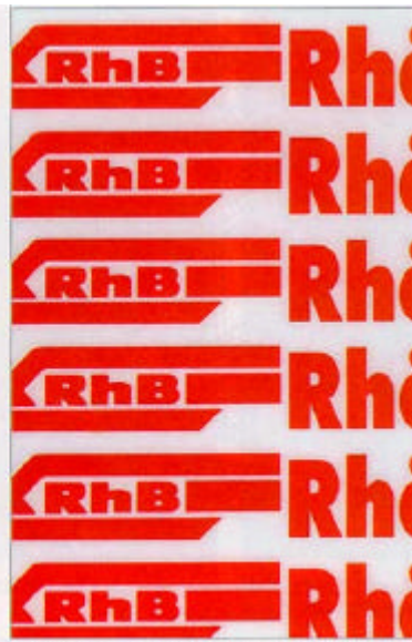
Champex-Linden: RhB-Eignerlogo als Haftketten