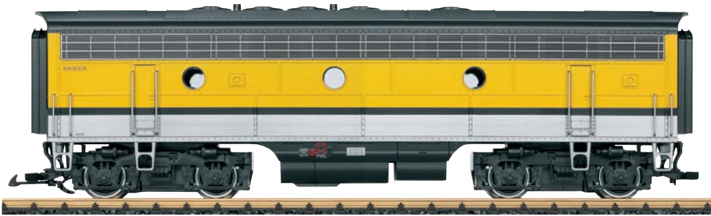
Modell der F7B 20588