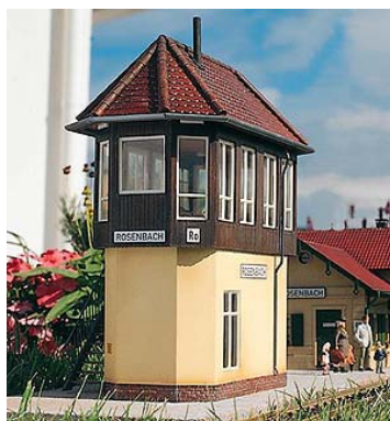
Abbildung siehe nächste Spalte!

Art.-Nr. PI62041A Regulärer CL Preis € 73,00 CL Aktionspreis € 55,00