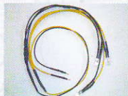
36014 LED Beleuchtung V60/BR260, 2 St. 9,99 €*