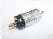
36003 Motor mit Schnecke V60/BR260 26,99 €*