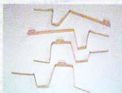
36115 Radsatzkontakte V60/BR260 8,49 €*